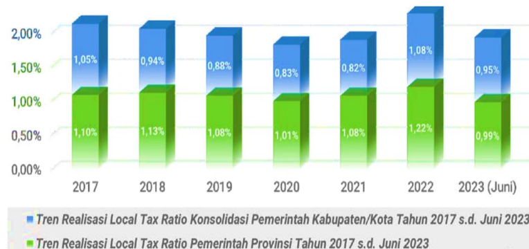
Grafik 1 Perkembangan Local Taxing Ratio Pemerintah Provinsi & Konsolidasi Pemerintah Kabupaten/Kota Lingkup Kalbar

pada tahun 2023 (Elena, 2023), sedangkan LTR Pemerintah Provinsi Kalimantan Barat paling tinggi hanya sebesar 1,22% (DJPB Kalbar, 2023).